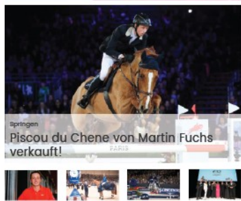
Springen Piscou du Chene von Martin Fuchs verkauft!